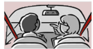
Examen de conducción